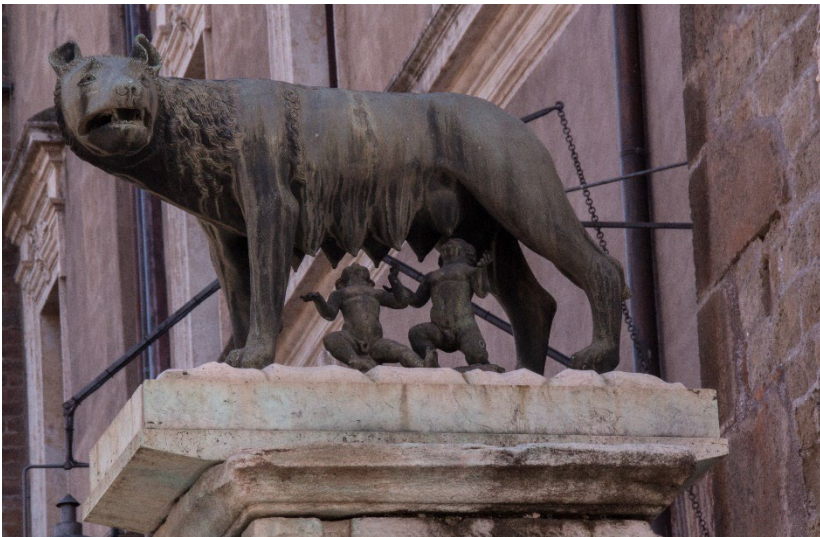
Die Wölfin mit Romulus und Remus auf dem Kapitol in Rom