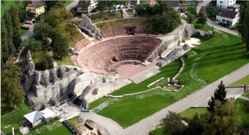
Das römische Theater in Augusta Raurica

Um die Spuren der Römer auch heute noch hautnah miterleben zu können, sind im Freifach Latein Exkursionen nach Vindonissa, Aventicum und Augusta Raurica geplant.